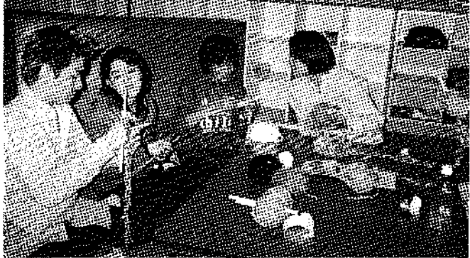
▲なぜかブームになった、あみもの。おちついた雰囲気

ある部屋では、5、6人の中学生がプレステ2のゲームで盛り上がりつつある。映画用のプロジェクターにゲーム機をつなぎ、スクリーンの大画面に映しているのが、ゲームセンターに負けない迫力だ。その中学生に混じって、大学生ぐらいの人も一緒に遊んでおり、その横でお菓子を食べながら見守っている人も。台所では中学生、高校生の女の子達が、4、5人集まってワイワイ歓声を上げながらのチーズケーキ作り。みんな