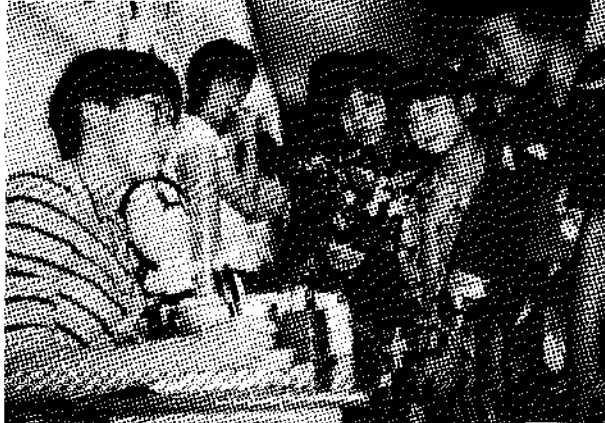
▲夏祭り「中学生のゲームコーナー」うけつけ姫

「小学生だけでなく、中学生にとっても居心地のいい場所にするには、どうしたらいいのだろうか？」