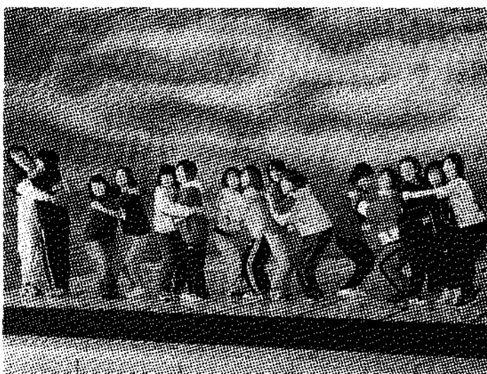
▲ オープニングの練習をする研修生。「ムズムズする熱い思い〜」

「劇フェス」は、(財)麒麟福祉財団の児童館活動に対するご理解あつての事業です。また今回の会場となったびわ湖こどもの国や滋賀県児童連など、関係各位の協力なく実施することは不可能でした。文末ながらここに感謝と敬意を表します。おそらく来年も実施されるでしょう。「やってみたいなあ」と思った方も少なくないと思いますが、とにかくその気になった子どもや職員さんがいるときに、思い切つて手を挙げてみればいかがでしょう。忙しくはなくても、決して損することはありませんから…。